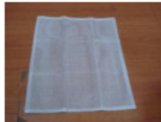
3 x Filterbeutel (J)