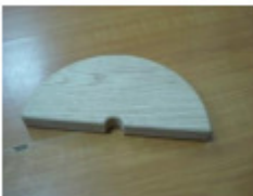
2 x halbrunde Holzplatten (F)