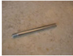
1 x Schraubstab (L)