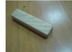
2 x Querstreben (H)