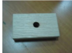
1 x Holzplatte (G)