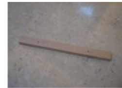
1 x Presskorb (E)