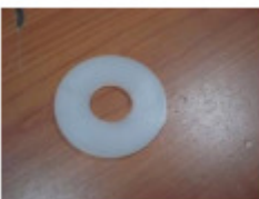
1 x Plastikring (I)