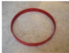
2 x Ringe (D)