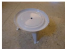
1 x Auffangvorrichtung (A)