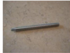
1 x Schraubstab (M)