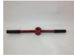
1 x Druckhebel (B)