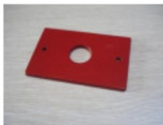
1 x Druckplatte (C)